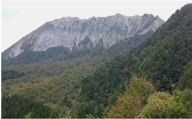
2016年鍵掛峠から大山(鳥取県)を望む