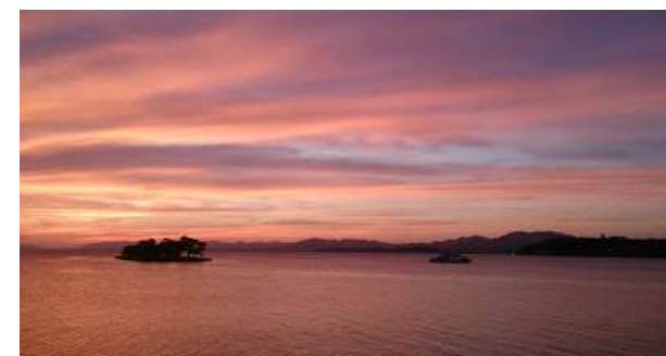
2015年秋 宍道湖の夕景